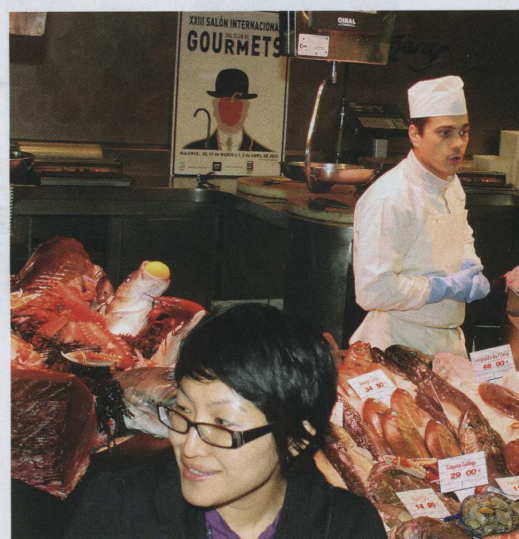
Exposición de pescados y mariscos.

La internacionalidad del XXIII Salón de Gourmets -miembro de UFI (Union de Foires Internationales) y, que desde 1992, ostenta el carácter de internacional otorgado por la Secretaría de Estado para el Comercio- viene avalada por la participación de productos procedentes de Alemania, Argentina, Bélgica, Brasil, Bulgaria, Colombia, Chile, Holanda, Hungría, Irlanda, Italia, India, Lituania, Malasia, Marruecos, Méjico, Noruega, Nueva Zelanda, Portugal, Reino Unido, República Checa, Rusia y Venezuela en la edición correspondiente a 2008.