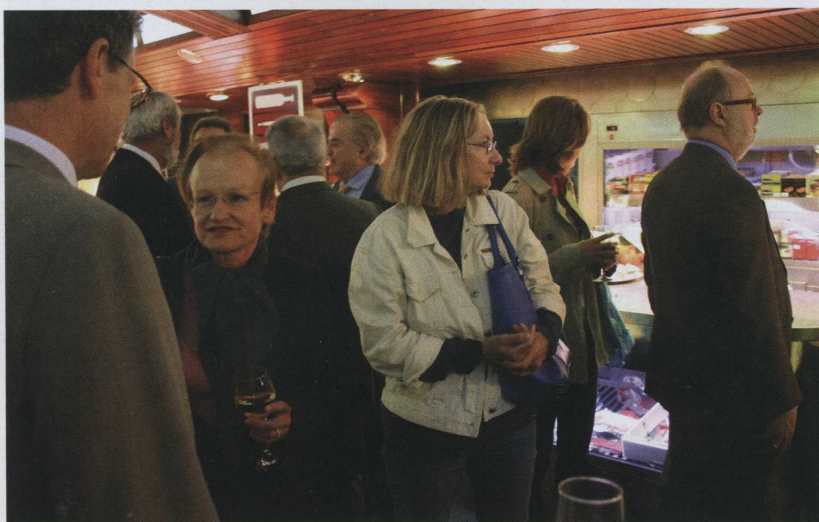
Invitados a la presentación.